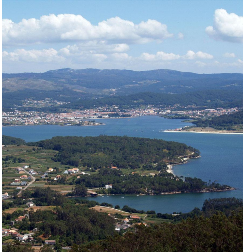
Enseada de Broña, puntas Carreiroa e O Picouto. Ao fondo Noia e a ría.