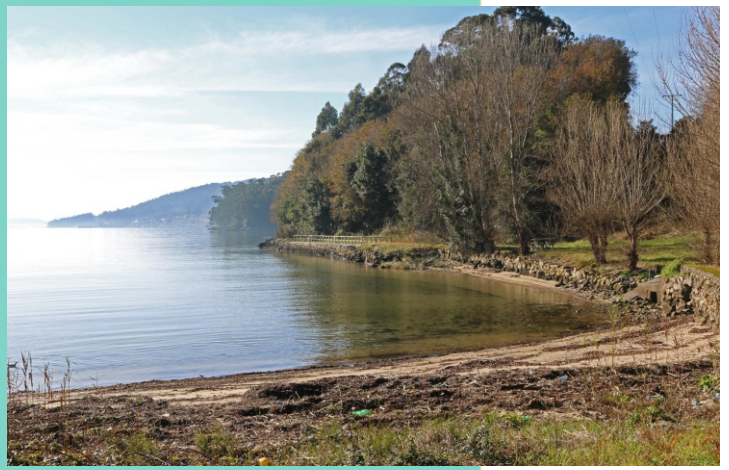
Enseada de Broña.