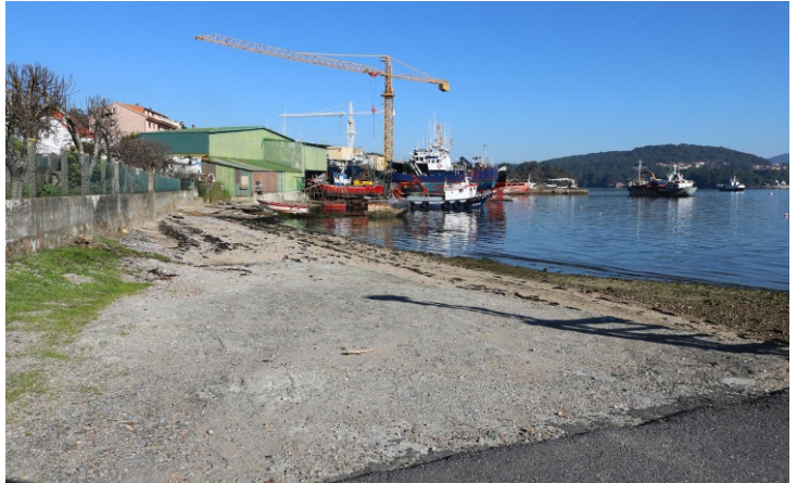
Praia de Picouso e estaleiros, unha das principais actividades de Outes.