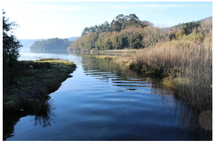
Río Bendimón. Nace serra do Tremuzo e despois de 5 km de percorrido desemboca na enseada de Broña.