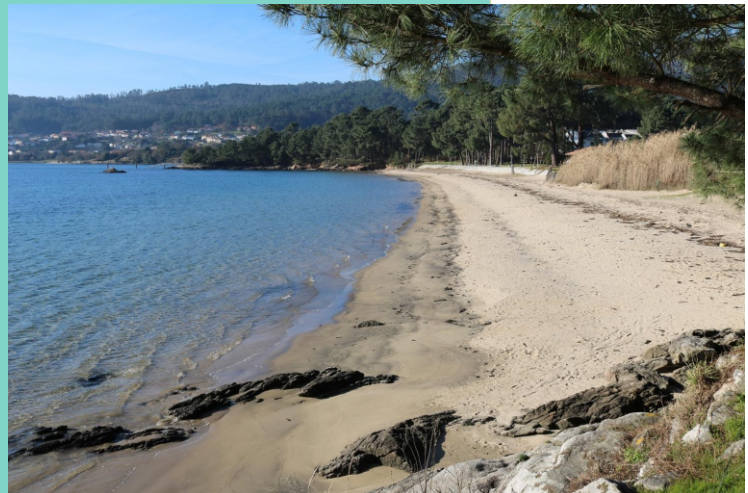
Praia de Mallante/Broña.