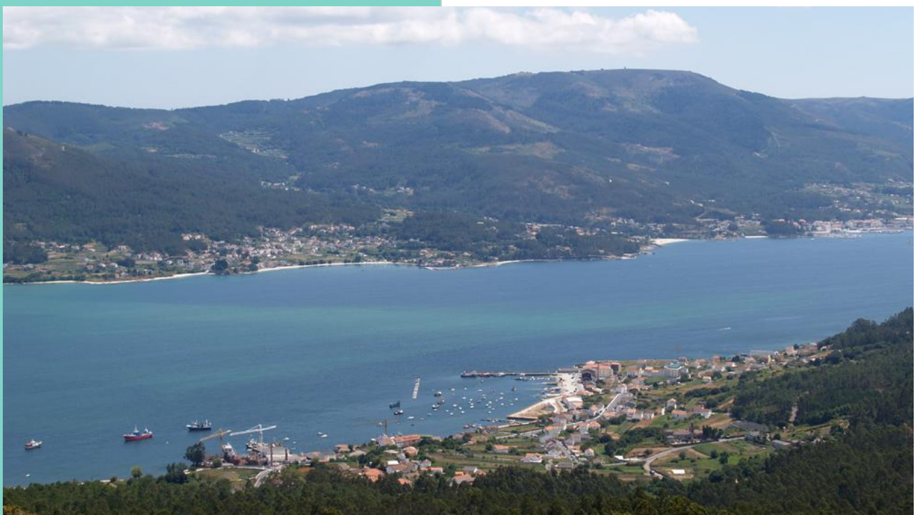
O Freixo e a ría desde o monte Tremuzo

Un percorrido con só uns curtos tramos pola beira da estrada con berma ou beirarrúa (no Freixo, para pasar máis alá do estaleiro, e da ponte da desembocadura do Bendimón á entrada da praia de Borna, para non pasar por propiedades privadas).