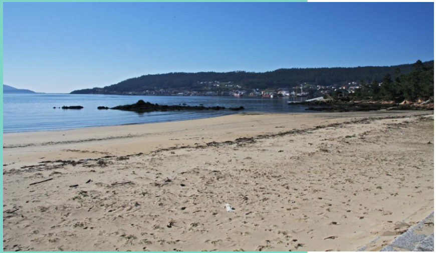
Praia de Broña