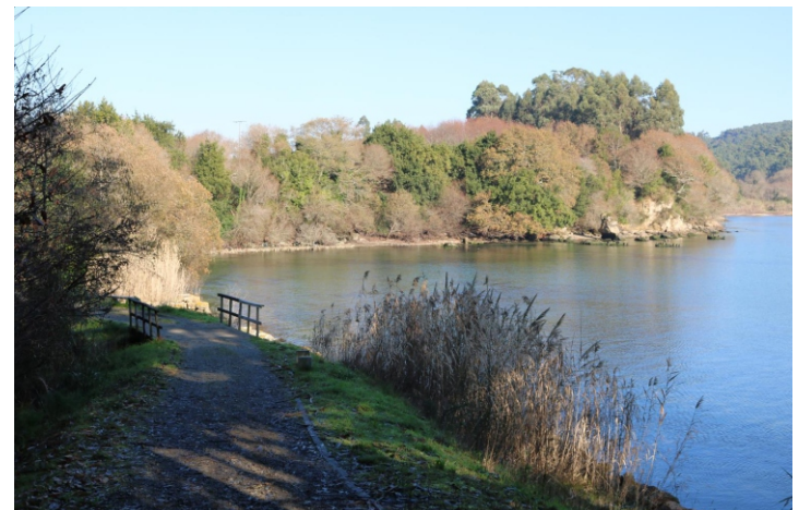
Enseada de Broña.