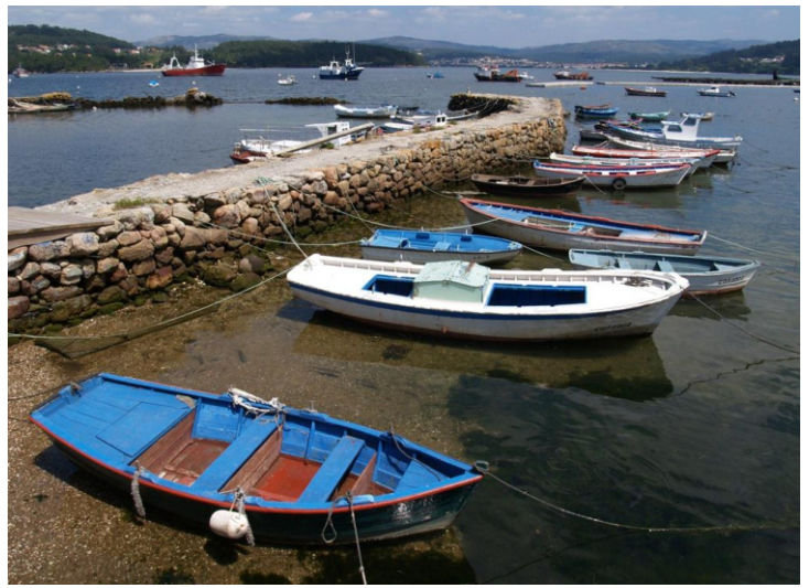
Antigo porto de O Freixo

A volta podémola facer polo camiño da ida ou unha parte volvendo polo interior: subindo ata Serantes e baixando logo ata a ponte da desembocadura do río Bendimón. A distancia que se percorre é máis ou menos a mesma pero as costas polo interior son máis grandes.