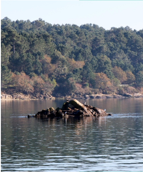
Outeiro dos Corvos