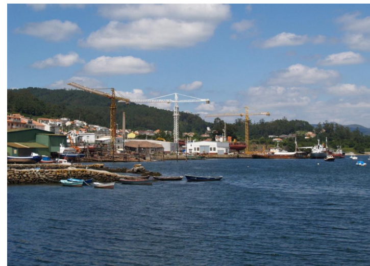
Ribeira do Freixo

Un percorrido lineal de case 6 km desde o Freixo á punta do Requeixo, que podemos prolongar un par de centos de metros ata un portiño abandonado no esteiro do rego de Serantes. Un paseo tranquilo con sombra e paisaxe por unha contorna natural de augas tranquilas nas que se suceden praias e rochedos (unhas praias que neste tempo non presentan o seu mellor aspecto por cousa das revolturas do mar e das follas que baixan polos regueiros).