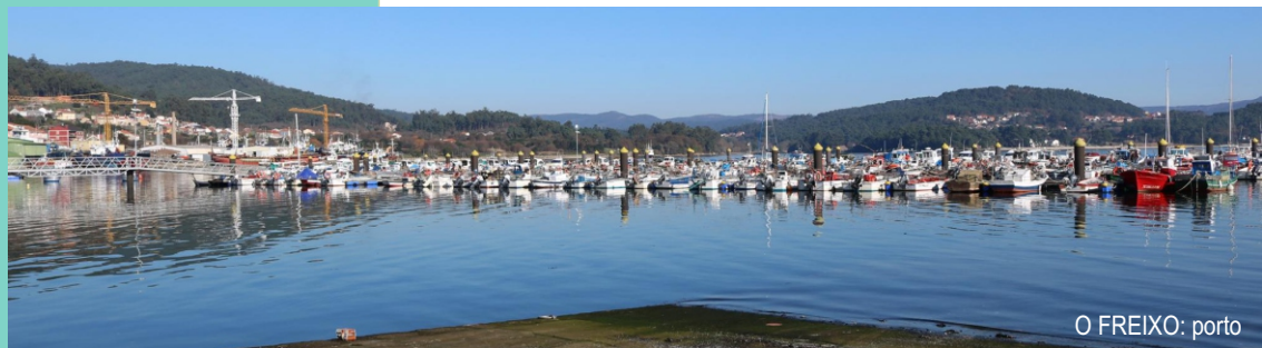
O FREIXO: porto