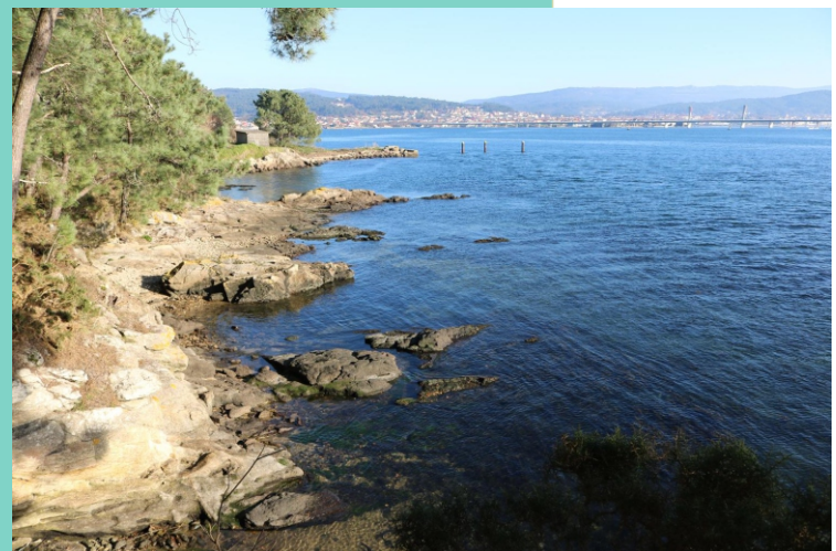
Punta do Requeixo, con Noia ao fondo