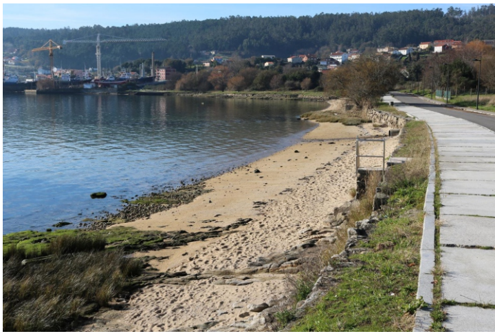
Praia de Siavo