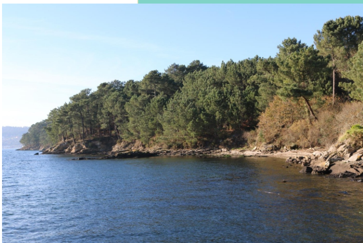
Punta do Picouto