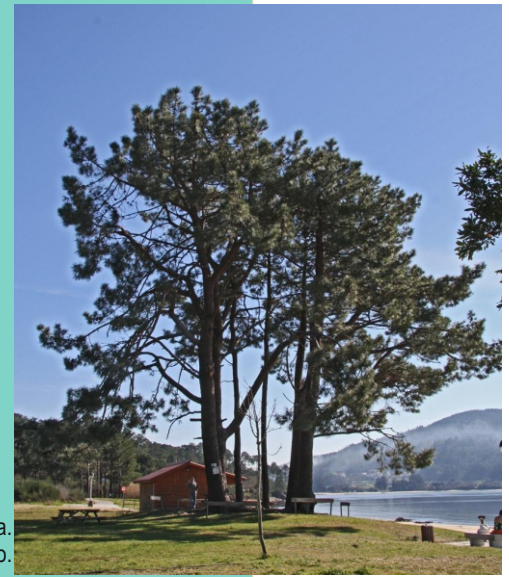
Piñeiros ( Pinus pinaster ) da praia de Broña. O máis grande mide 4 m de perímetro.