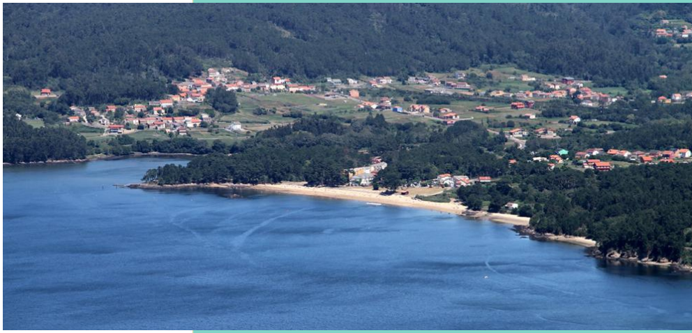
Praia de Mallante/Broña.