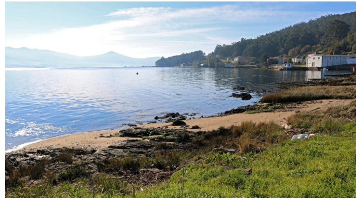
Punta Corveira, no comezo do paseo do Freixo